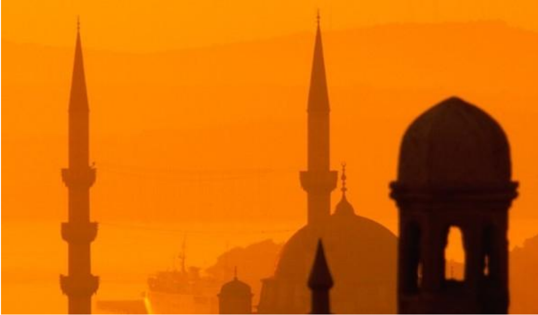
Hagia Sofia. Astăzi, în Istanbulul turcesc