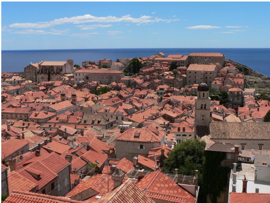
Dubrovnik, Croația. Centrul vechi.