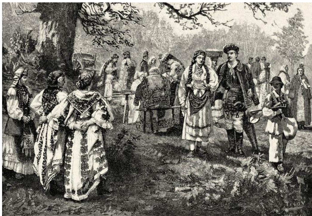
Costume populare croate. Desen din secolul al XIX-lea.