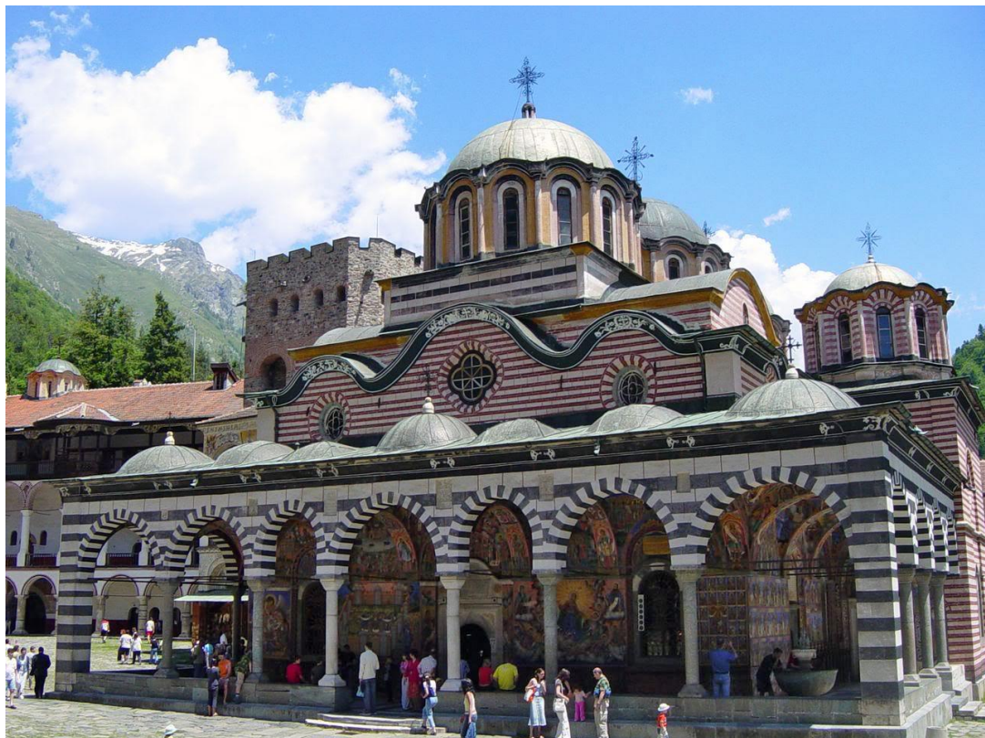
Mănăstirea Rila, Bulgaria. Conform tradiției, a fost ctitorită de Sfântul Ian din Rila în secolul al X-lea.