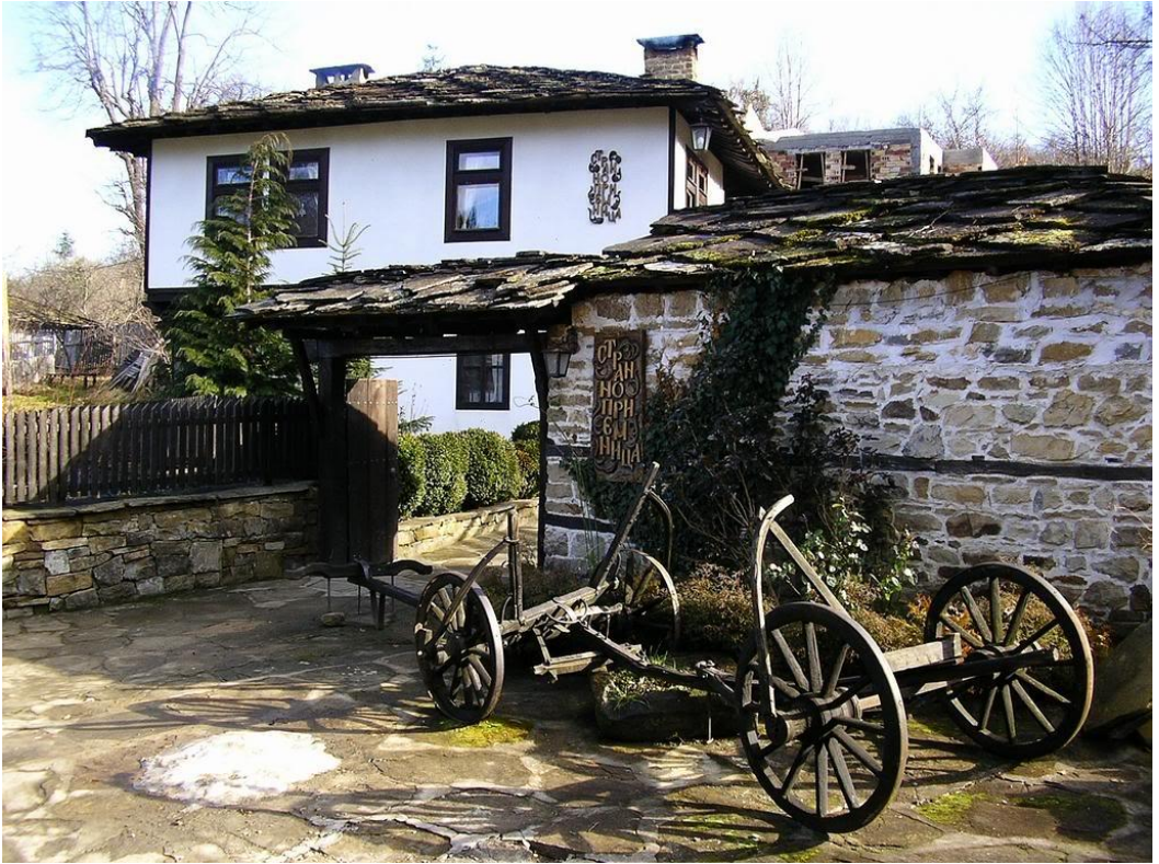
Pitorescul sătuc Bojenci, Bulgaria.