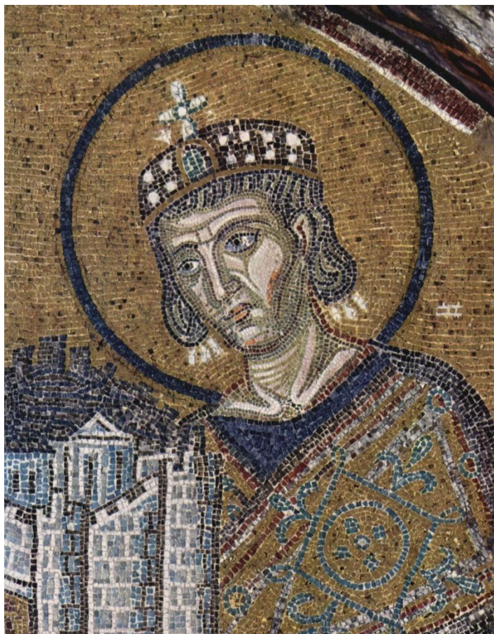
Împăratul Constantin cel Mare. Mozaic din Biserica Sf. Sofia, cca. 1000