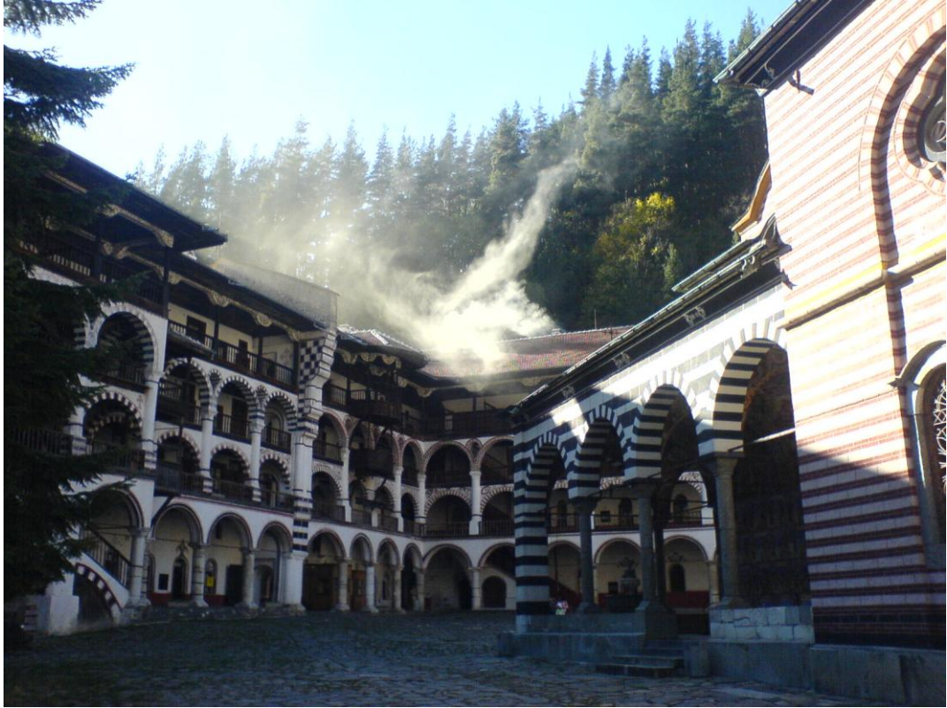
Mănăstirea Rila. Vedere din interior.