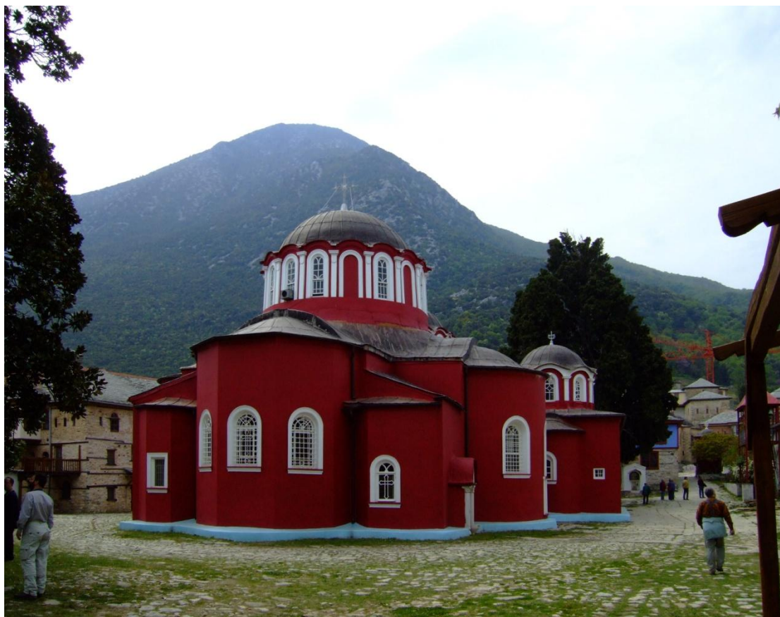
Biserica Mănăstirii Lavra, datând din secolul al X-lea. Muntele Athos, așezământ monastic autonom, Grecia.