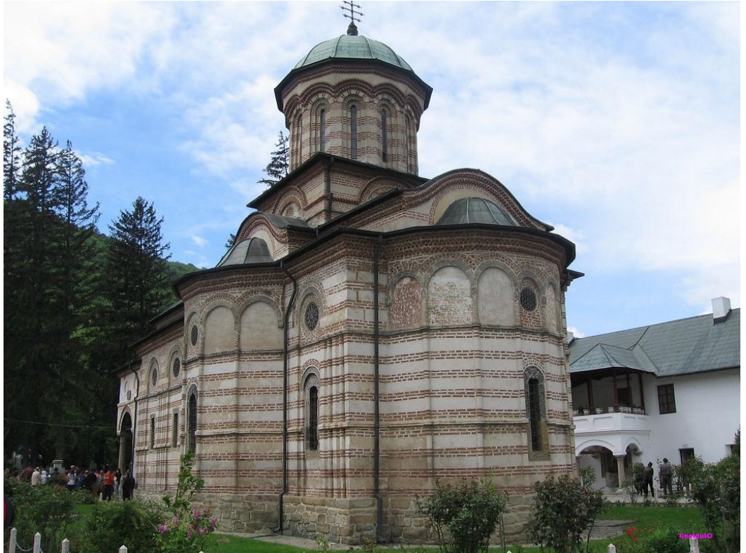
Mănăstirea Cozia, pe malul Oltului. Ctitorie a domnitorului Mircea cel Bătrân, din secolul al XIV-lea.