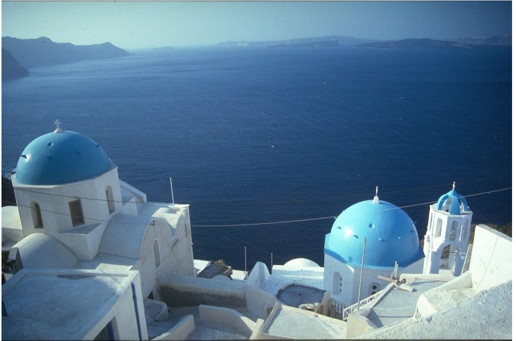
Santorini. Peisaj mediteranean din Grecia.